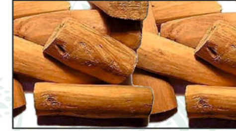
Sandal Wood (Srighandham)