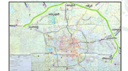
Proposed Regional Ring Road