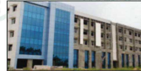
AIIMS Medical University