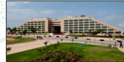
Pocharam IT Park