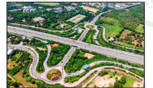
Outer Ring Road